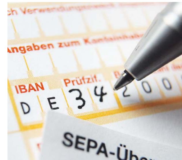
Überweisung: Unternehmen misstrauen häufig neuen Zahlungssystemen.

Fintechs wie Traxpay revolutionieren derzeit die Finanzwelt. Doch viele Mittelständler setzen in Deutschland bei der Digitalisierung von Zahlungsverhalten auf vertraute Partner: Etablierte Softwareanbieter sind für 48 Prozent der Unternehmen der erste Ansprechpartner, wenn es darum geht, ihre Finanzprozesse zu digitalisieren. Für 29 Prozent ist die Hausbank die erste Anlaufstelle, 14 Prozent setzen auf andere Dienstleister, und lediglich neun Prozent vertrauen den Diensten von Fintechs, so eine aktuelle Studie des Business- und IT-Beratungshauses Syracom.