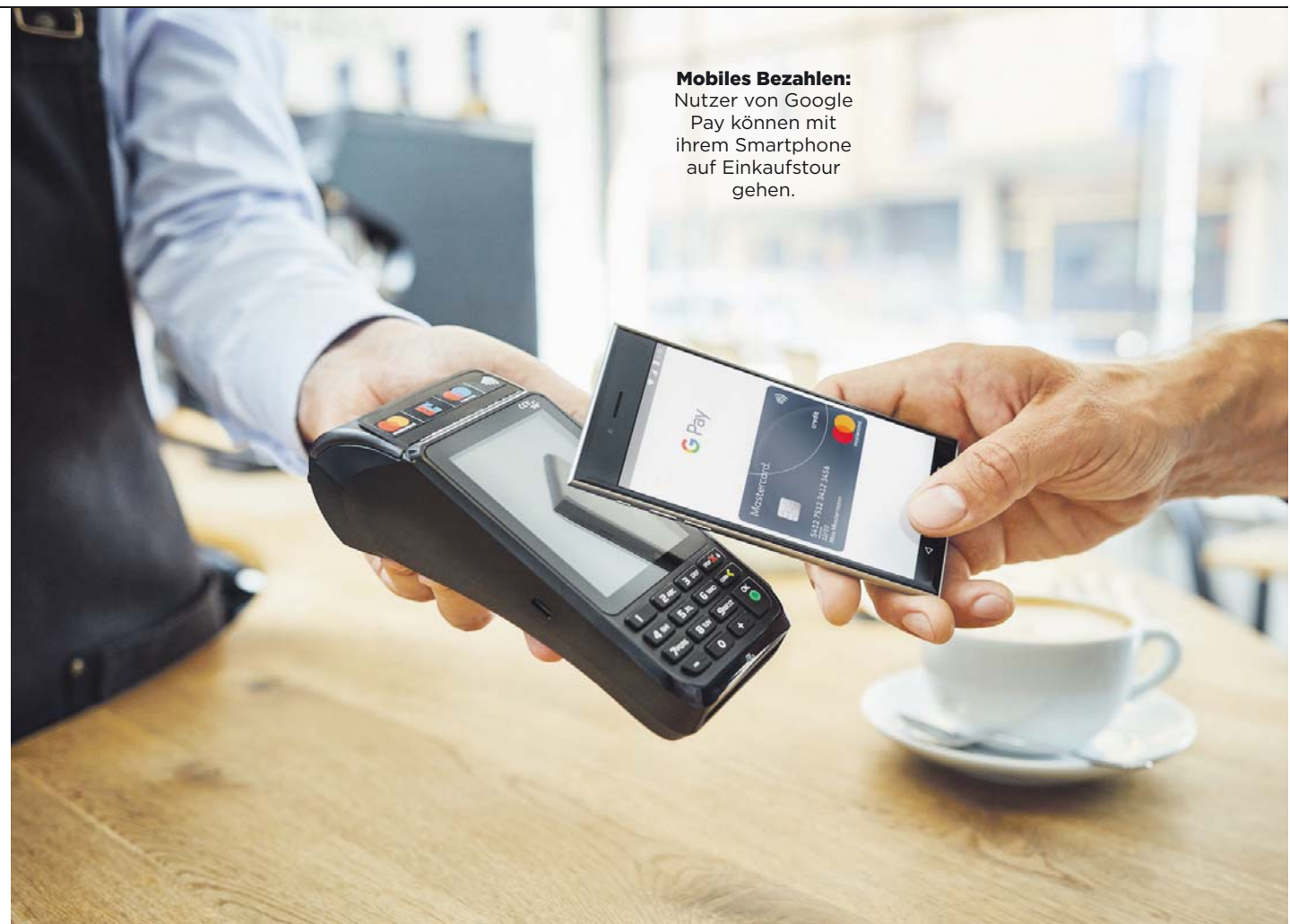
Mobiles Bezahlen: Nutzer von Google Pay können mit ihrem Smartphone auf Einkaufstour gehen.

Dabei sind die Deutschen grundsätzlich offen für neue Technologien. Smartphones oder Tablets sind hierzulande ähnlich weit verbreitet wie bei den europäischen Nachbarn. Je-